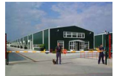
Parc Industrial DIBO