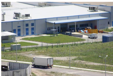
Parc Industrial Ploiesti

Baicoi : METEOR ( capital chinez ) si PARC INDUSTRIAL BAICOI SCHELA (capital italian)