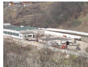
Parc Industrial Prahova