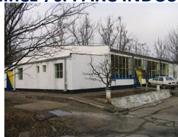
Parc Industrial Ploeni